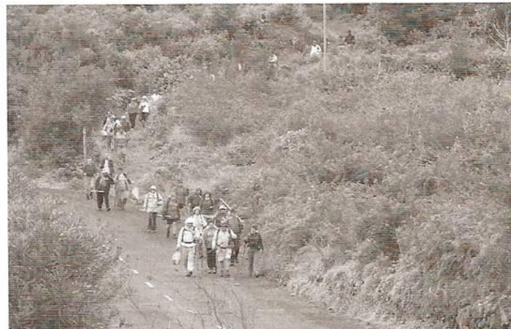
El Club “El Atajo” organiza caminatas como rutas temáticas

Aparte de las caminatas montamos proyecciones de fotografía digital, charlas formativas, limpieza de senderos, comidas y cenas de convivencia,... así como participar en las actividades a las que nos invita otras entidades como la Consejería de Medio Ambiente del Cabildo Insular de La Palma y en general nos gusta participar en todo lo que esté relacionado con los senderos y la naturaleza.