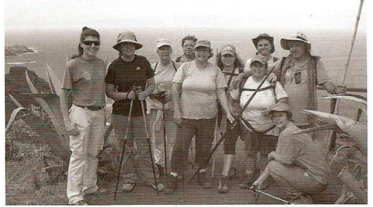
El pasado día 31 de octubre 164 caminantes del CD "El Atajo" recorrieron el camino Real de La Costa en 10 etapas

algunos aspectos como: facilitar el acceso a los mismos (ya que en muchas rutas el punto de salida y llegada son diferentes) bien a través de un transporte público más variado o a través de un transporte contratado más económico o subvencionado debido a que suele salir mucho dinero y que acudimos con frecuencia al mismo por la cantidad de inscripciones con la que contamos; así como, formar en prevención y actuaciones de emergencia para mejorar la seguridad de los caminantes.